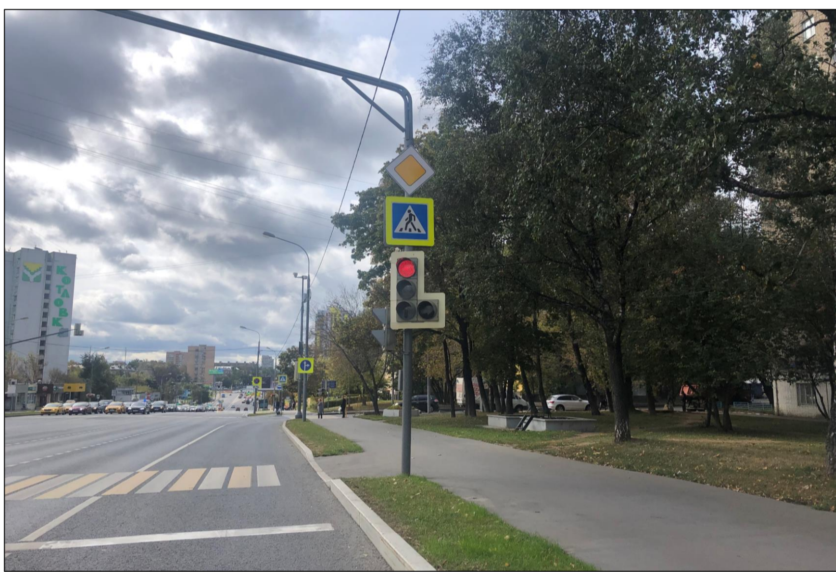
5 СУЩЕСТВУЮЩЕЕ ПОЛОЖЕНИЕ ВИД С ПЕШЕХОДНОЙ ДОРОЖКИ ОЗЕЛЕНЕННОЙ ТЕРРИТОРИИ