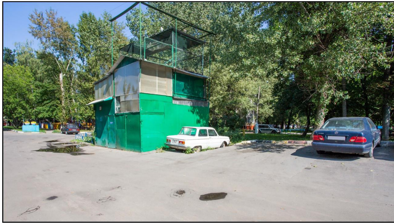
4 СУЩЕСТВУЮЩЕЕ ПОЛОЖЕНИЕ ВИД С ПРОЕЗДА ВНУТРЕННЕГО ПОЛЬЗОВАНИЯ